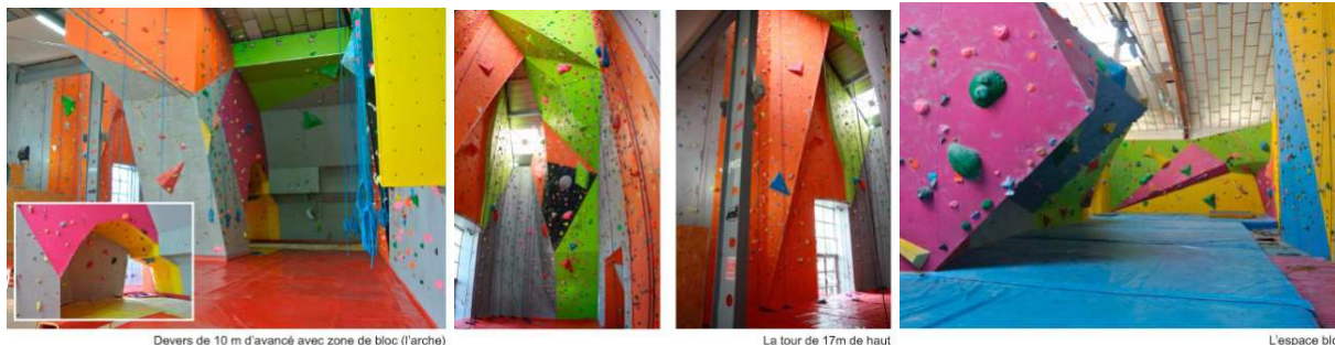
Devers de 10 m d'avancé avec zone de bloc (l'arche)