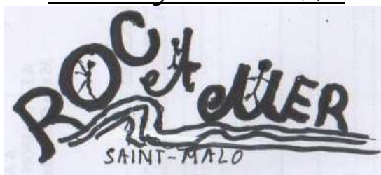
Voici une première proposition