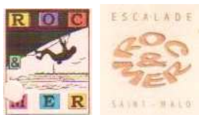
Anciens logos de Roc et Mer